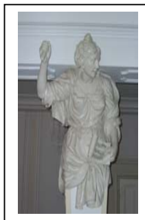
musica sacra vocaliter

Die Musiker musizieren kostenfrei, bitten aber alle Besucher um eine großzügige Spende zugunsten der weiteren Restaurierung der Ludwigskirche.