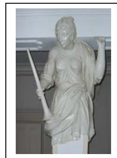
musica sacra instrumentaliter